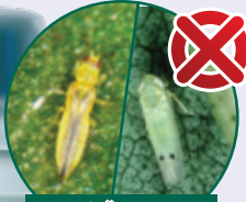
سبز تیلہ، تھرپس