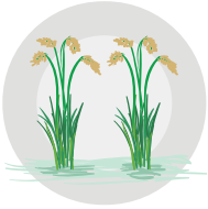
زیادہ پیداوار کا حصول