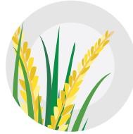
دانوں کی بھرپور بھرائی میں مددگار