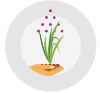
پودے کی مناسب نشوونما